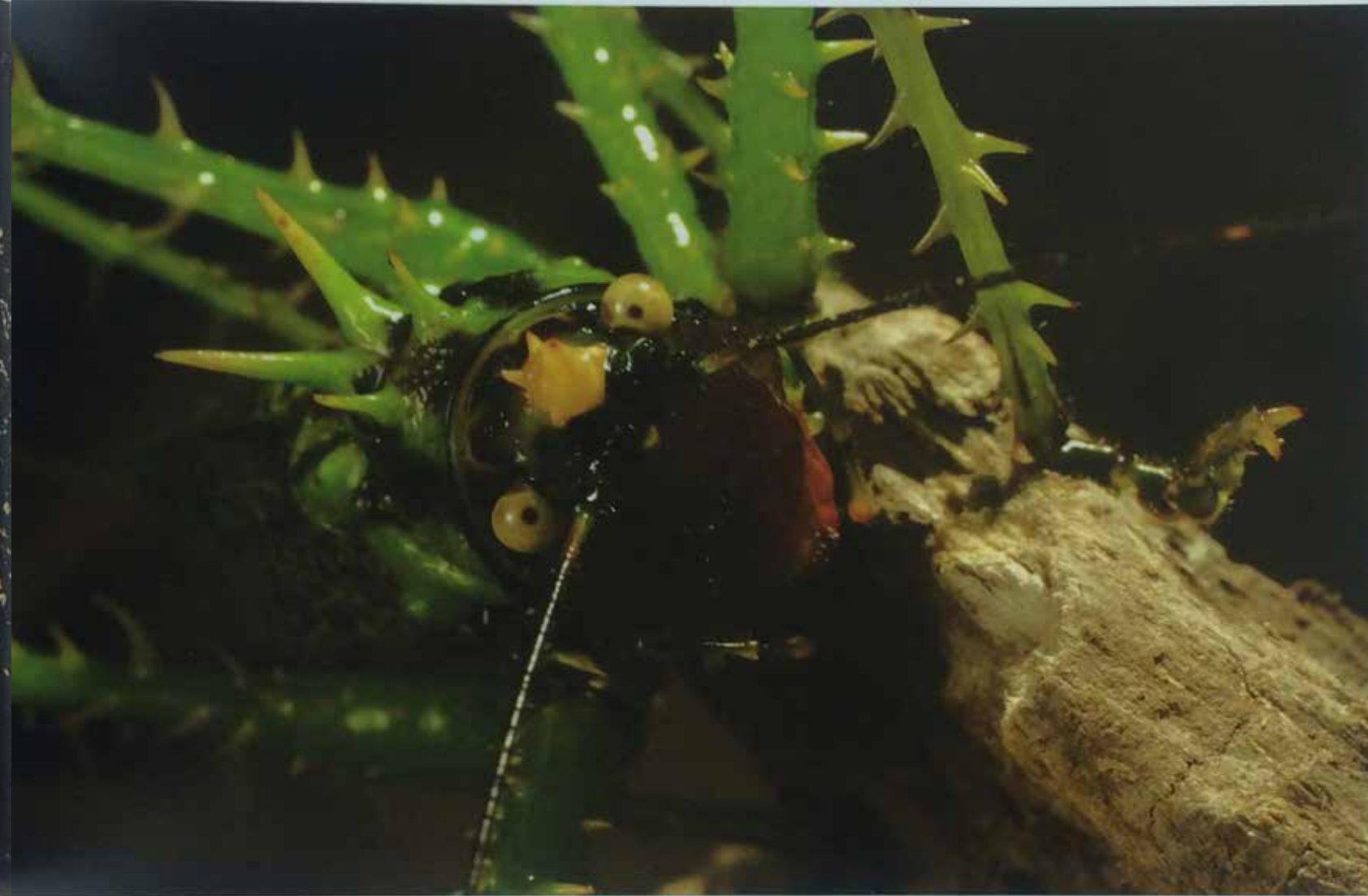
Inocencia, temura, defensa.

Psilidognathus sp. (Cerambycidae), Loreto, provincia de Napo, abril 2006. (RC)