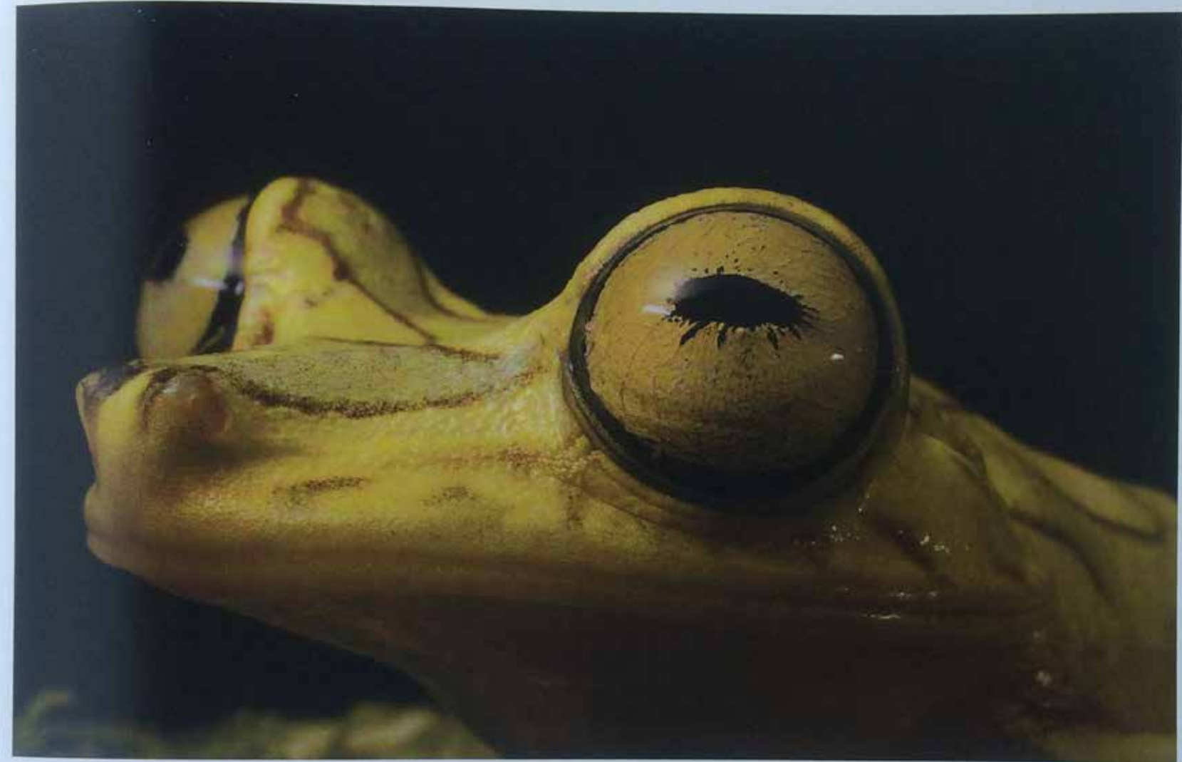
“Por una mirada un mundo...”

Aeshna sp. (Aeshnidae), Bosque Protector Los Cedros, provincia de Imbabura, julio 2005. (RC)