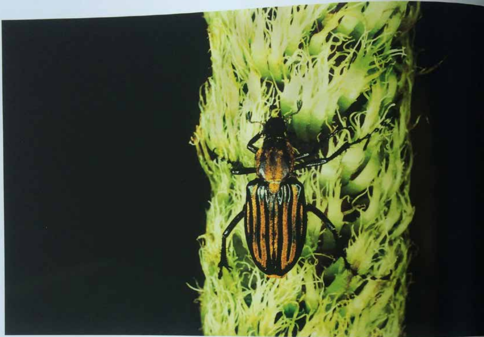
Escalando, abriendo camino, escapando.

Macrodactylus sp. (Scarabaeidae: Melolonthinae), Bosque Protector Los Cedros, provincia de Imbabura, junio 2005. (RC)