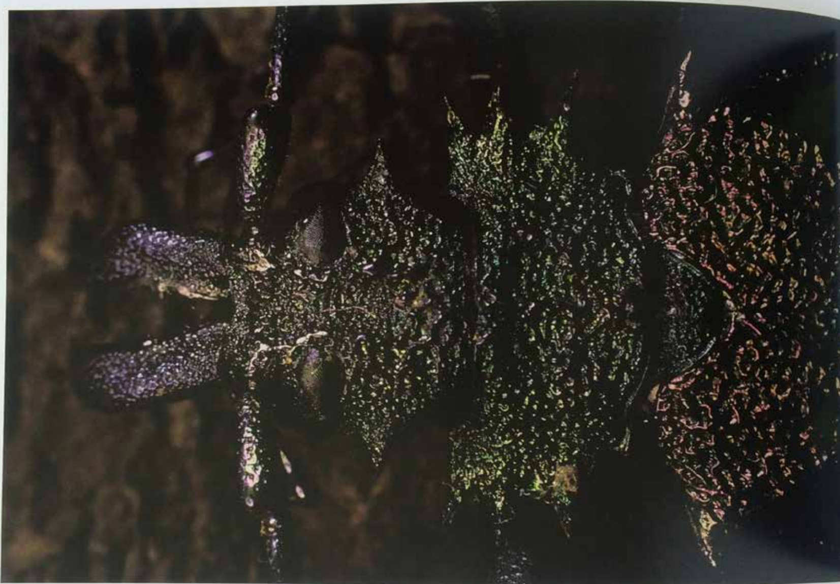
Formas, colores, texturas y tamaños: caprichosos ensayos de la evolución.

Psilidognathus sp. (Cerambycidae), Loreto, provincia de Napo, abril 2006. (RC)